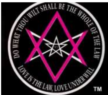
Symbol 33 ste graad van de Vrijmetselarij

Alle genootschappen drijven op leugens en misleiding. Hoe groter je leugens, hoe hoger je rang. Zo goed als iedereen, die is doorgebroken aan de top in de politiek; justitie; media; het bedrijfsleven; de muzikwereld; sportwereld; filmwereld; etc. maakt deel uit van deze genootschappen, anders zullen ze je niet toelaten. Ze houden elkaar namelijk allemaal de hand boven het hoofd.