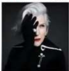
Het Alziend oog