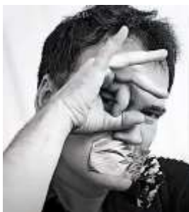
Symbol van 666