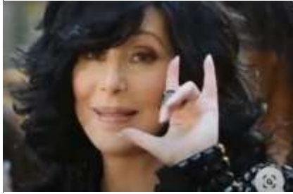
De horens van Baphomet