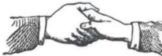
FIG. 11: PASS GRIP OF A FELLOW CRAFT

.D., while holding the candidate by this grip: